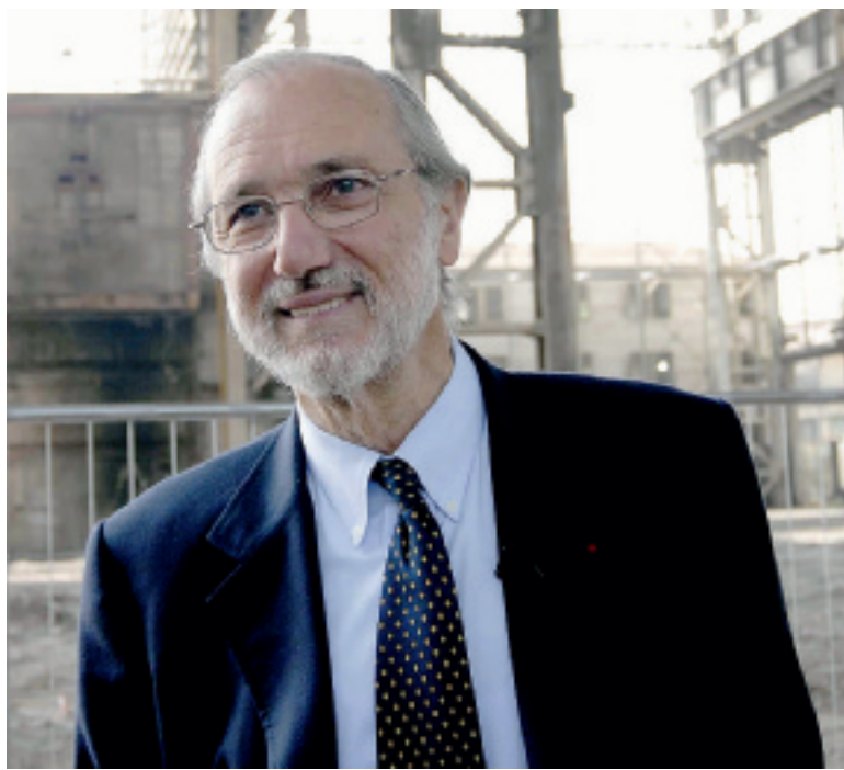
L'architetto Renzo Piano durante un sopralluogo nell'ex area Falck

LA FIRMA ANNUNCIATA ieri mattina è una boccata d'ossigeno per il gruppo che, soltanto una settimana fa, ha incassato il duro colpo del sequestro dell'area milanese di Santa Giulia per presunte irregolarità nelle opere di bonifica. A quasi un anno dalla stesura del piano di salvataggio, Vincen-