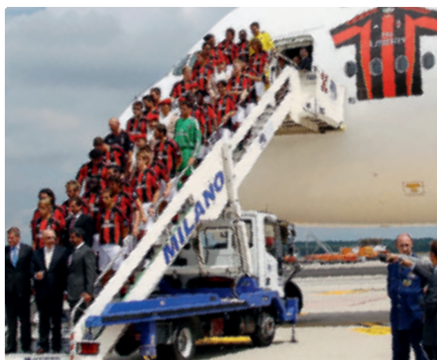
L'aereo della Fly Emirates e le colorate coreografie del Milan. L'arrivo degli sceicchi è un vanto per Malpensa