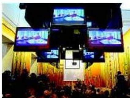
VERSO L'EXPO La giornata

barda, Camera di Commercio e Fondazione Politecnico di Milano) in grado di attirare a Milano ogni anno i migliori giovani creativi di tutto il mondo. «L'obiettivo - recita la nota del Comune - è di promuovere e stimolare un forte innalzamento qualitativo di master di eccellenza erogati dalle migliori scuole milanesi nelle varie discipline nelle quali si articola il De-