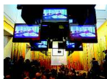
VERSO L'EXPO La giornata

barda, Camera di Commercio e Fondazione Politecnico di Milano) in grado di attirare a Milano ogni anno i migliori giovani creativi di tutto il mondo. «L'obiettivo recita la nota del Comune - è di promuovere e stimolare un forte innalzamento qualitativo di master di eccellenza erogati dalle migliori scuole milanesi nelle varie discipline nelle quali si articola il De-